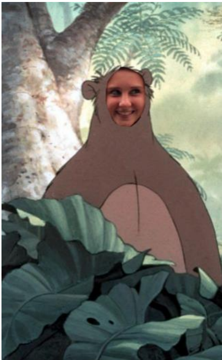
Luna aka Baluna